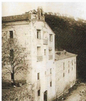
1. Antiga espadanya de la campana de les hores de la Cartoixa de Porta-Coeli, inexistent en l'actualitat

En els "Annals de la Cartoixa de Porta-Coeli", realitzats per un frare del monestir al segle XVIII amb els documents de l'arxiu antic de la Cartoixa, ens conten: