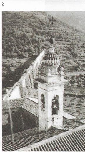
2. Espadanya de la capella de Sant Joan de la Cartoixa de Porta-Coeli, on es trobava la campana Santa Maria d'Olocau 3. Torre-Campanil de la Cartoixa de Porta-Coeli on es trobava la campana Santa Maria de Bètera

a la parròquia, un dels tocs més significatius que solia tocar, era el toc de mort d'Albaet, quan es moria un xiquet o xiqueta que no havia pres la Primera Comunió.