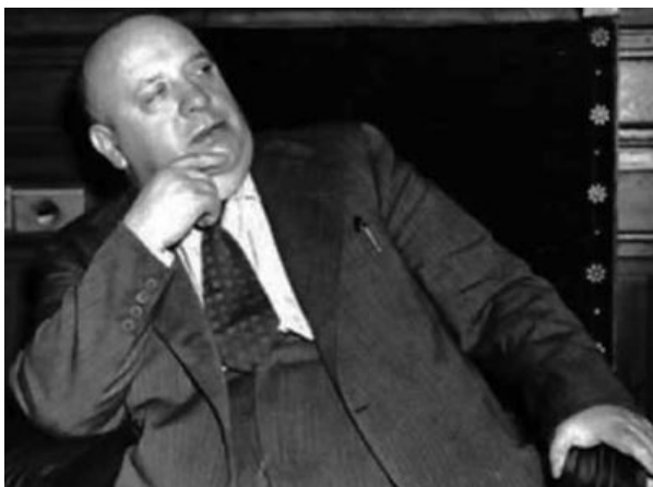
Indalecio Prieto, ministre de Defensa Nacional de la II República espanyola, resident a la masia del Pollastre entre novembre de 1936 i octubre de 1937

També la masia va ser testimoni d'un memorable episodi: l'intent de bescanvi del polític i advocat, Justino de Azcàrate, presoner dels falangistes, amb el que va ser cofundador de la Falange junt a José Antonio Primo de Rivera, Raimundo Fernández Cuesta, que estava pres per la República a València. En dos ocasions s'entrevistà Indalecio amb Raimundo a la masia; la gran amistat establerta entre els dos personatges va acabar en què, el ministre concedís la llibertat incondicional del pres, procedir que seria contestat de la mateixa manera des de Burgos deixant lliure Justino.