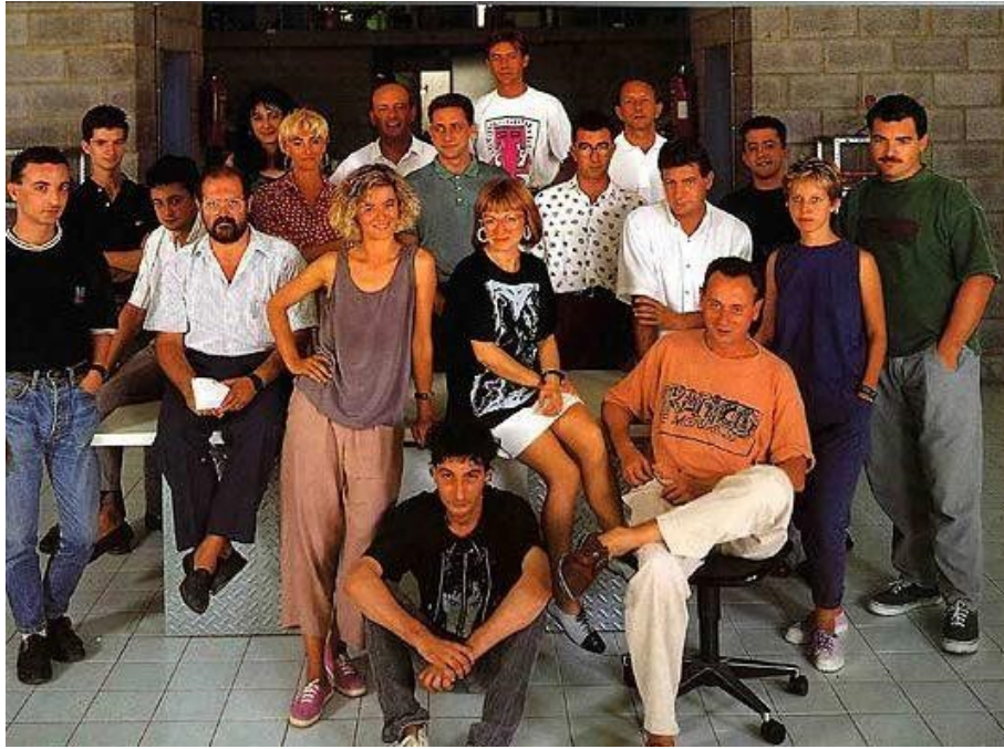
La Nave 1984-1990