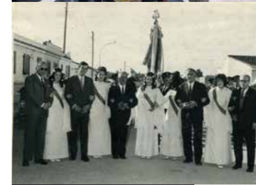
Dalt, celebració de Santa Cecília del Centre Artístic Musical l'any 1972. En la imatge, apareixen alguns dels directius fundadors de la societat musical i les cinc muses.