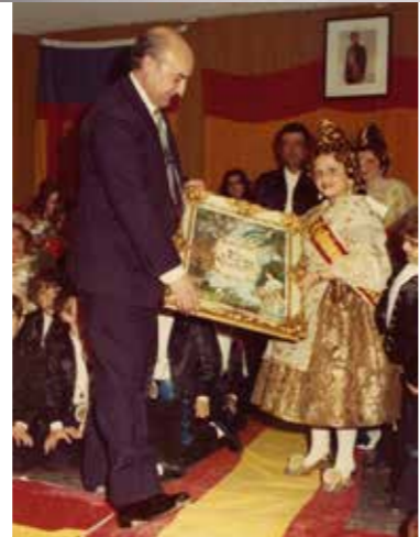
Diploma d'agraïment que li varen entregar els fallers infantils de Bétera