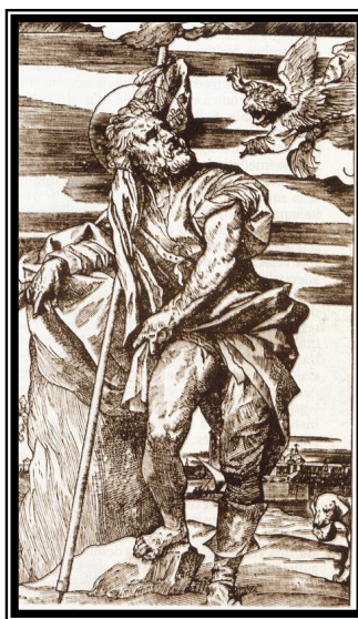
Sant Roc (Gravat de l'història de la seva vida, por Tiziano, Bristsh Museum, Londres)