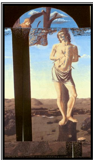
Els sants protectors contra la pesta: Sant Sebastià (Tabla de l'escola de AndreaCastagno, hacia 1457, The Metropolitan Museum of art, Nueva York)

Fos com fos, el contagi es generalitzà i s'estengué arreu.