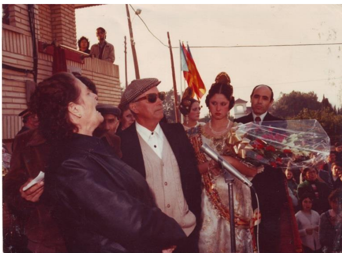
Inauguració del Carrer Xiquet de Bétera, 16 de març de 1979.