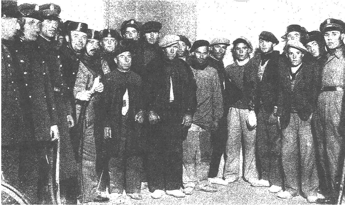
REVOLUCIONARIS DE BÉTERA PRESONERS