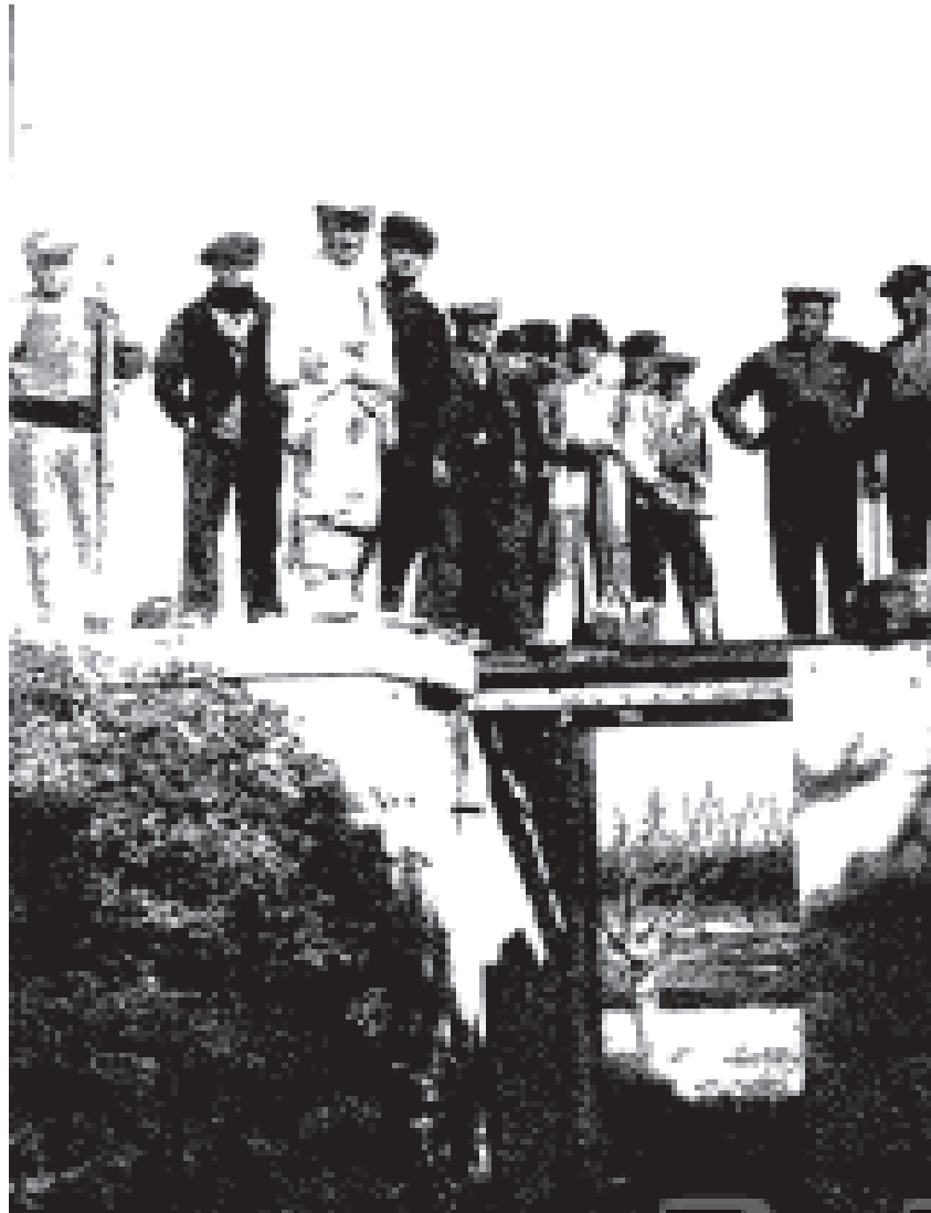
DESPERFECTES OCASIONATS A LA VIA DEL TRENET