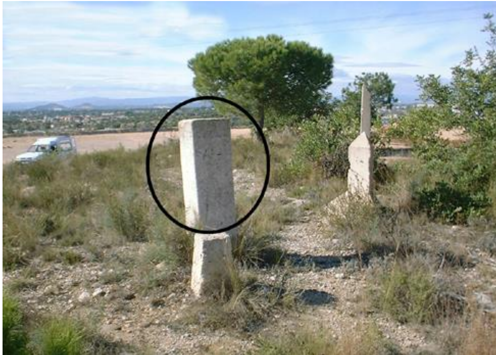
Molló situat darrere de l'urbanització la Creu de Gràcia

De l'estudi cartogràfic se'n deriven les consideracions següents: en primer lloc, tant la cartografia urbanística, com la cadastral, no coincidixen amb el límit real entre els termes municipals, es dona inclús el cas de vivendes en què per exemple, el menjador es troba a Godella i la cuina a Paterna. En segon lloc, la trama urbana no ha respectat en absolut el terme municipal i almenys els vials havien d'haver seguit el límit, cosa que no ocorre en absolut. Este fet es posa especialment de manifest en les urbanitzacions la Creu de Gràcia i Campolivar. Com a conseqüència d'estos fets, es poden produir, i de fet es produïxen, conflictes entre els dos municipis en temes tan variats com la gestió i planificació urbanística, recaptació de tributs municipals (especialment l'impost de béns immobles) o inclús el subministrament de servicis com l'aigua potable, l'enllumenat o l'arreplega de fems.