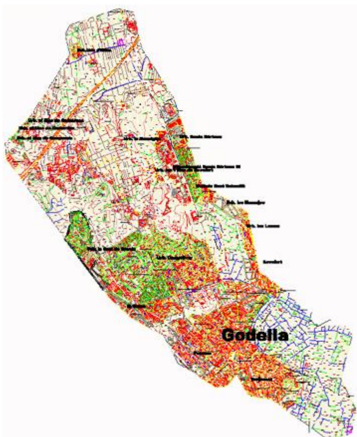
Municipi de Godella, situat a la comarca de l'Horta Nord (València)

Fa al voltant d'un segle que l'Institut Geogràfic Nacional va dur a terme els treballs topogràfics per a definir i cartografiar la delimitació dels municipis a tot Espanya de forma sistemàtica. La importància d'estes operacions radica en el fet que és la primera vegada que es mesura i legitima de forma completa la divisió municipal del país, per mitjà d'actes de delimitació. Este fet implicava l'acord sobre la situació dels mollons i línies límit, l'alçament topogràfic dels perímetres municipals i el traçat en una cartografia a escala 1:25.000. Estos treballs van ser la culminació d'un llarg procés que va començar amb la primera definició moderna de municipi, que es va fixar en la Constitució de 1812 o de Cadis.