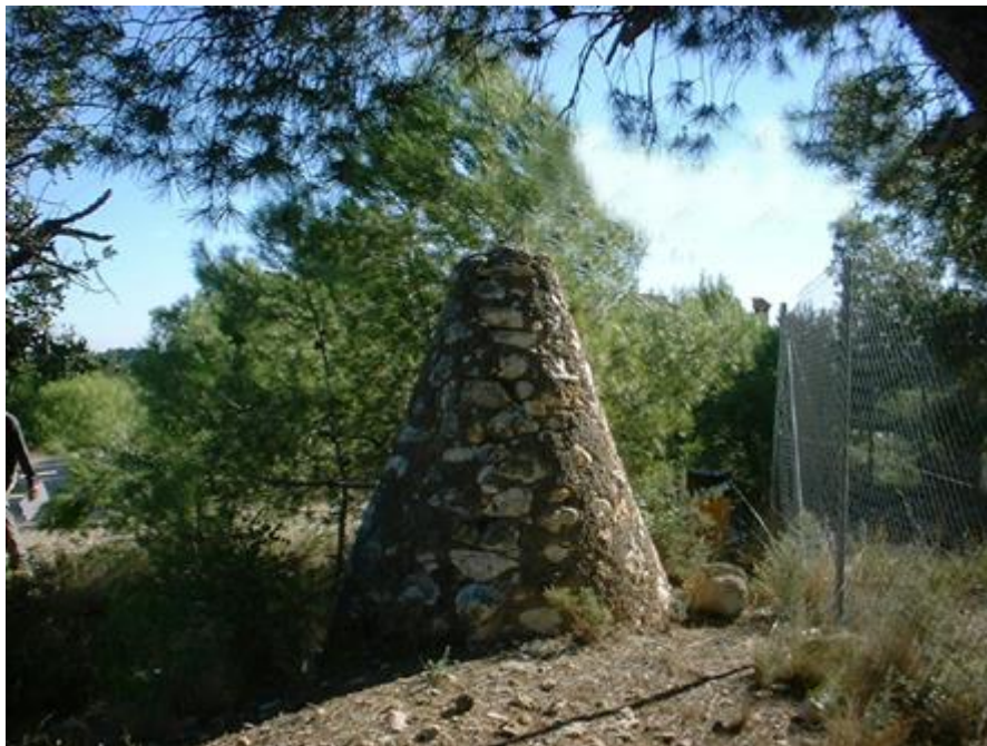
Molló que defineix els límits entre els municipis de Godella, Paterna i Bétera

S'ha dut a terme l'estudi de la línia límit que separa els termes municipals de Godella i Paterna a la província de València. Es tracta d'una línia de 4,1 kilòmetres de longitud delimitada per mitjà de huit mollons.