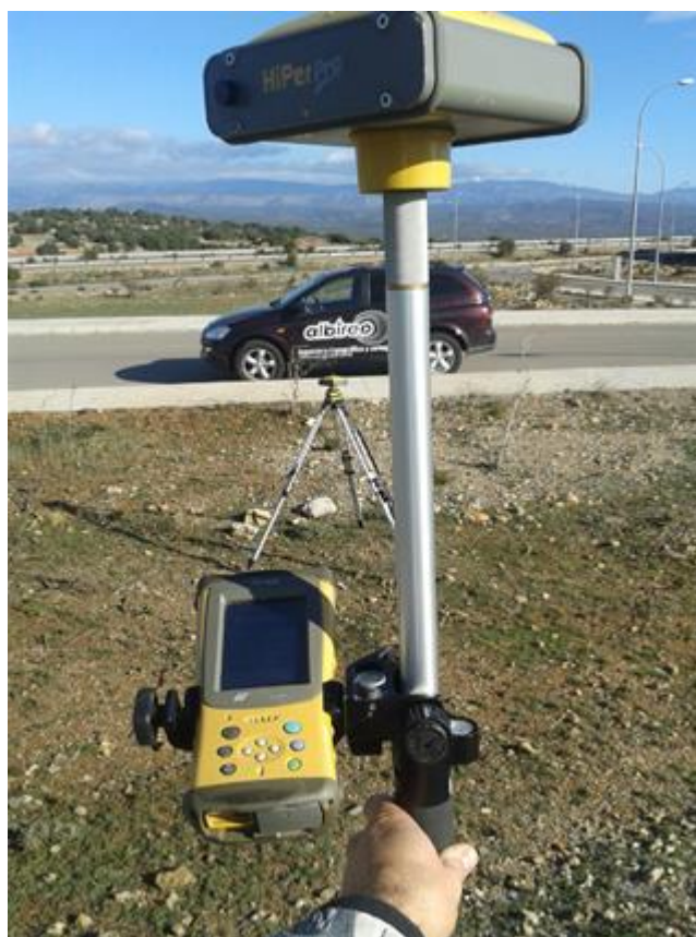
Medició topogràfica a Paterna amb un modern equip geodèsic GPS

elements físics estables reconeguts tant en el pla intern (el propi municipi) com extern (municipis limítrofs). Històricament, les formes que el poder polític ha utilitzat per a fixar l'àmbit dels territoris han sigut diverses, però potser la més coneguda, és la que ha consistit a col·locar sobre el terreny unes marques (encreuaments, pilars, pedres, incisions sobre roques), que unides per una línia imaginària, formen el perímetre jurisdiccional. Estes fites o mollons es caracteritzen pel seu emplaçament destacat i per estar construïts pensant en la seua permanència. De sobra és conegut que tant egipcis com romans delimitaven i fitaven parcel·les privades. Els primers, obligats per les periòdiques crescudes del Nil, que esborraven els senyals existents, i els segons, per a repartir les terres conquistades entre els colons i els soldats llicenciats, dibuixant sobre el terreny les centúries per mitjà de mollons, en l'encreuament de límits, els limes.