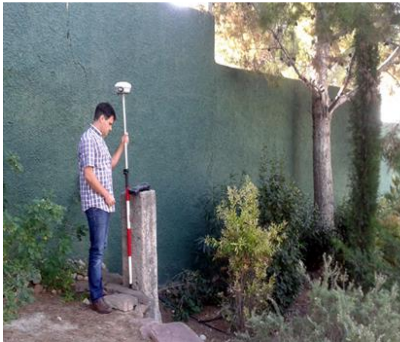
Medició topogràfica de molló situat en una propietat privada de l'urbanització la Creu de Gràcia

En concret, es van calcular les coordenades planimètriques dels mollons esmentats en el sistema de referència geodèsic oficial europeu, l'European Terrestrial Reference System 1989 (ETRS89) i el sistema cartogràfic Universal Transverse Mercator (UTM).